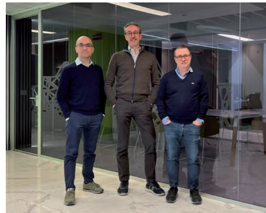
Das Team von DATEV.it, von links: